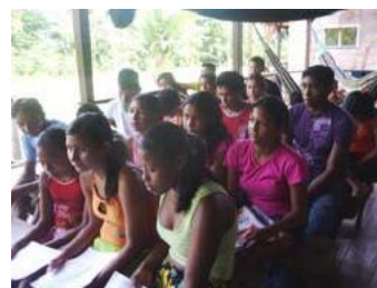
Alunos na escola J.W. Marriott, Jr em Boa Frente.

A Fundação de Amparo à Pesquisa do Estado do Amazonas forneceu bolsas a 25 membros da comunidade do Juma para condução de pesquisa da floresta tropical que futuramente ajudará a demonstrar os benefícios nutricionais, médicos e econômicos da proteção à floresta tropical. O programa de seis meses é coordenado pela FAS e inclui um guia dos professores das escolas J.W. Marriott, Jr locais, bem como visitantes especialistas em nutrição e botânica. A pesquisa desenvolvida pelos estudantes tem como foco plantas medicinais, avaliação e localização de necessidades nutricionais locais, o potencial comercial das castanhas-do-pará e as propriedades nutricionais do Camu Camu (um fruto local rico em vitamina C). Os estudantes relatarão suas descobertas para a FAS e para as famílias da Reserva em fevereiro de 2011.