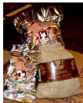
Castanhas cultivadas no Juma distribuídas nos mercados locais.

Os moradores do Juma participaram do seu primeiro curso sobre a produção de castanhas-do-pará no ano passado e a primeira colheita está agora nos mercados brasileiros. O Sam's Clubs, uma divisão do Wal-Mart Stores Inc., começou a vender as castanhas e o Renaissance São Paulo hotel planeja incluí-las em seu serviço de abertura de cama e como um ingrediente em várias opções do cardápio como parte do esforço para aumentar a consciência e os fundos da Reserva do Juma.