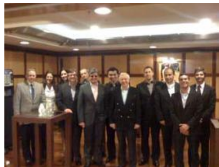
Representantes da FAS durante encontro com o South America Business Council da rede Marriott no Renaissance São Paulo.