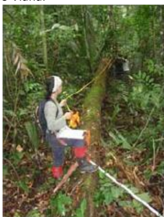
Monitoramento e avaliação na Reserva de Desenvolvimento Sustentável do Juma.