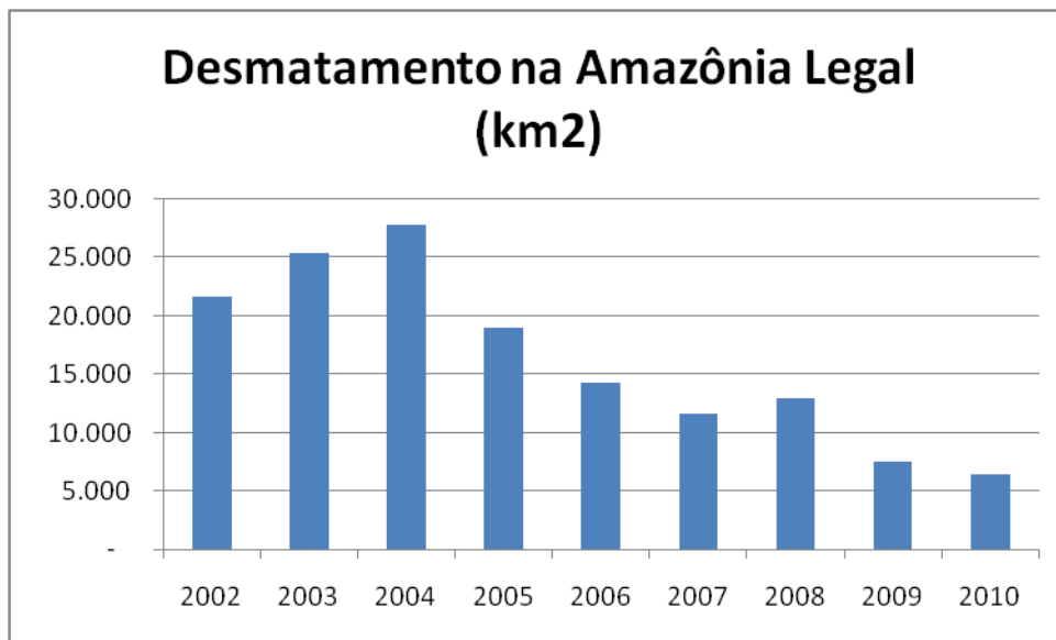
Figura 1. Desmatamento na Amazônia Legal (em km 2 ) (PRODES, 2011). Para mais informações, acesse http://www.obt.inpe.br/prodes/prodes_1988_2010.htm .

É fato que o relatório da Força Tarefa e o apoio político dos Governadores da Amazônia, ministros e Presidente da República impulsionaram mudanças no posicionamento dos negociadores brasileiros. Entretanto, ainda há muito a avançar. O Brasil ainda aposta exageradamente nos mecanismos de financiamento inter-governamental, sem compensações de emissões. Mecanismos de mercado para o carbono florestal ainda são vistos com restrições. Com isso, o país está perdendo uma oportunidade de criar valor para os serviços ambientais providos pelas florestas amazônicas – tema sobre o qual existe expressiva base científica dentro e fora do país. A redução do desmatamento já está ocorrendo desde 2004 (figura 1) e corremos o risco de perder o reconhecimento deste expressivo esforço e notável conquista nacional. O Brasil tem mais a perder do que a ganhar com o postergamento da inclusão das florestas como instrumento de compensação de parte das emissões dos países industrializados.